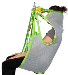
Silhouette Sling Polyester Net Art. Nr. 25015

Der Silhouette-Hebegurt ist ein bequemer Gurt ohne Verstärkungen, Griffe oder Polsterungen. Er passt sich dem Körper des Patienten/Pflegebedürftigen an und unterstützt so den gesamten Körper optimal. Der Hebegurt lässt sich in den meisten Hebesituationen einsetzen und ist speziell für den Transfer auf und von einem Stuhl oder Rollstuhl geeignet.