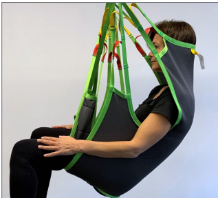
Silhouette Sling Soft Art. Nr. 25019

komfortabel optimale Passform Kopfstütze